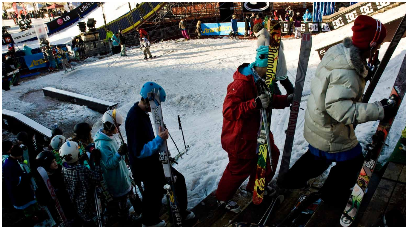
■ Slopestyle blir ny OS-gren i Sotji 2014.