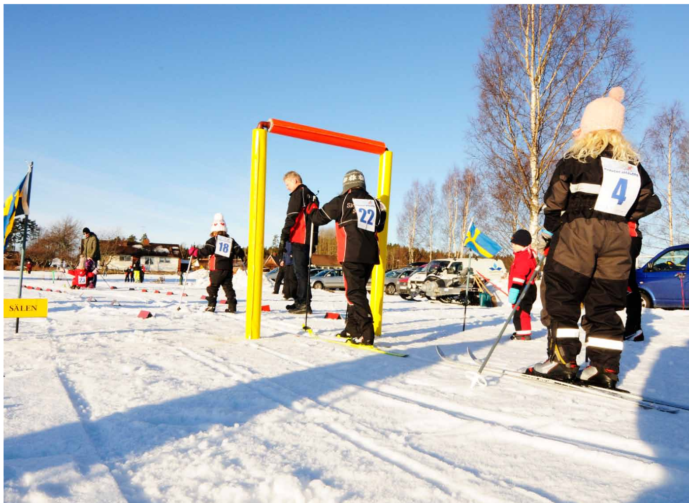
■ Skidverksamhet i Skultuna. Barnens skidlekplats är populärt.