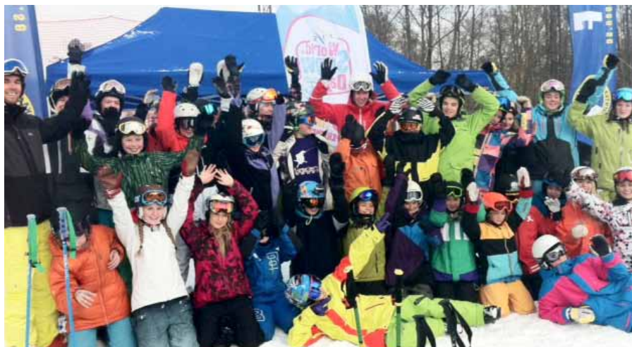
■ Massor av glada deltagare på World Snow Day i Stockholm.