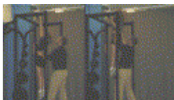
Chins med hjälp